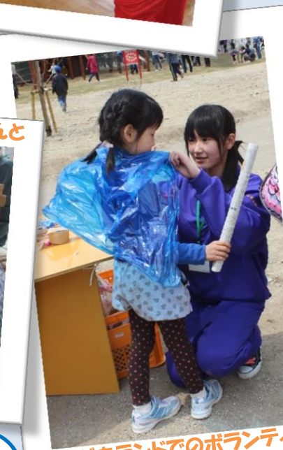
あそびあランドでのボランティア♪

しゃかいふくしきょうぎかい 社会福祉協議会では、子どもたちや こうれいしゃ しょう かた いっしょ 高齢者、障がいのある方と一緒に、 このような活動を通して交流しな がら ちいき でのつながりの輪をひろ げているんだね♪