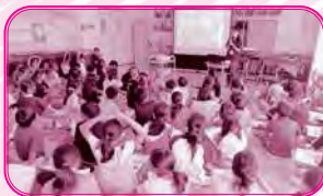
講話 ふくしてなあに？