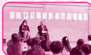
車いすユーザーの方と交流