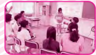
講話 妊婦さんの生活と産後ケア