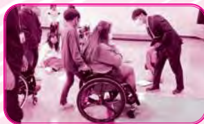
車いす体験と交流