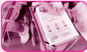
講話 ふくしてなあに？